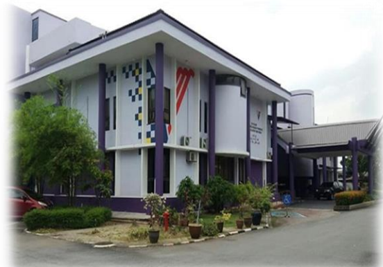
Kompleks DVS Selangor di Lot 2, Jalan Utas 15/7 Shah Alam dari tahun 1993 hingga sekarang