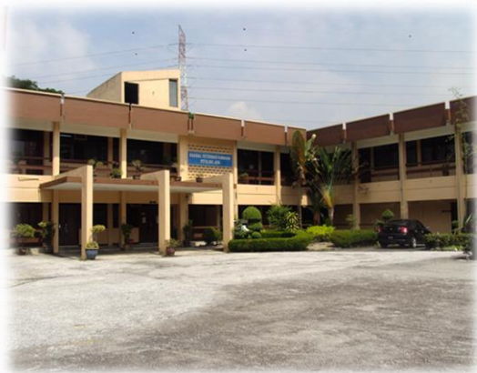
Kompleks DVS Selangor dan Makmal Diagnosa Veterinar Petaling Jaya dari tahun 1971-1993.

Untuk memenuhi hasrat Kerajaan Negeri yang mahukan semua Ibu Pejabat Jabatan Kerajaan Negeri dipusatkan di Ibu Negeri Selangor, iaitu di Bandaraya Shah Alam, maka pada bulan Oktober tahun 1993 Ibu Pejabat Perkhidmatan Haiwan Negeri Selangor telah berpindah ke bangunan barunya yang terletak di Lot 2 Jalan Utas 15/7, Seksyen 15, 40630 Shah Alam. Melalui Penjenamaan semula Jabatan ini kemudiannya diikenali sebagai Jabatan Perkhidmatan Veterinar Negeri Selangor atau ringkasnya DVS Selangor